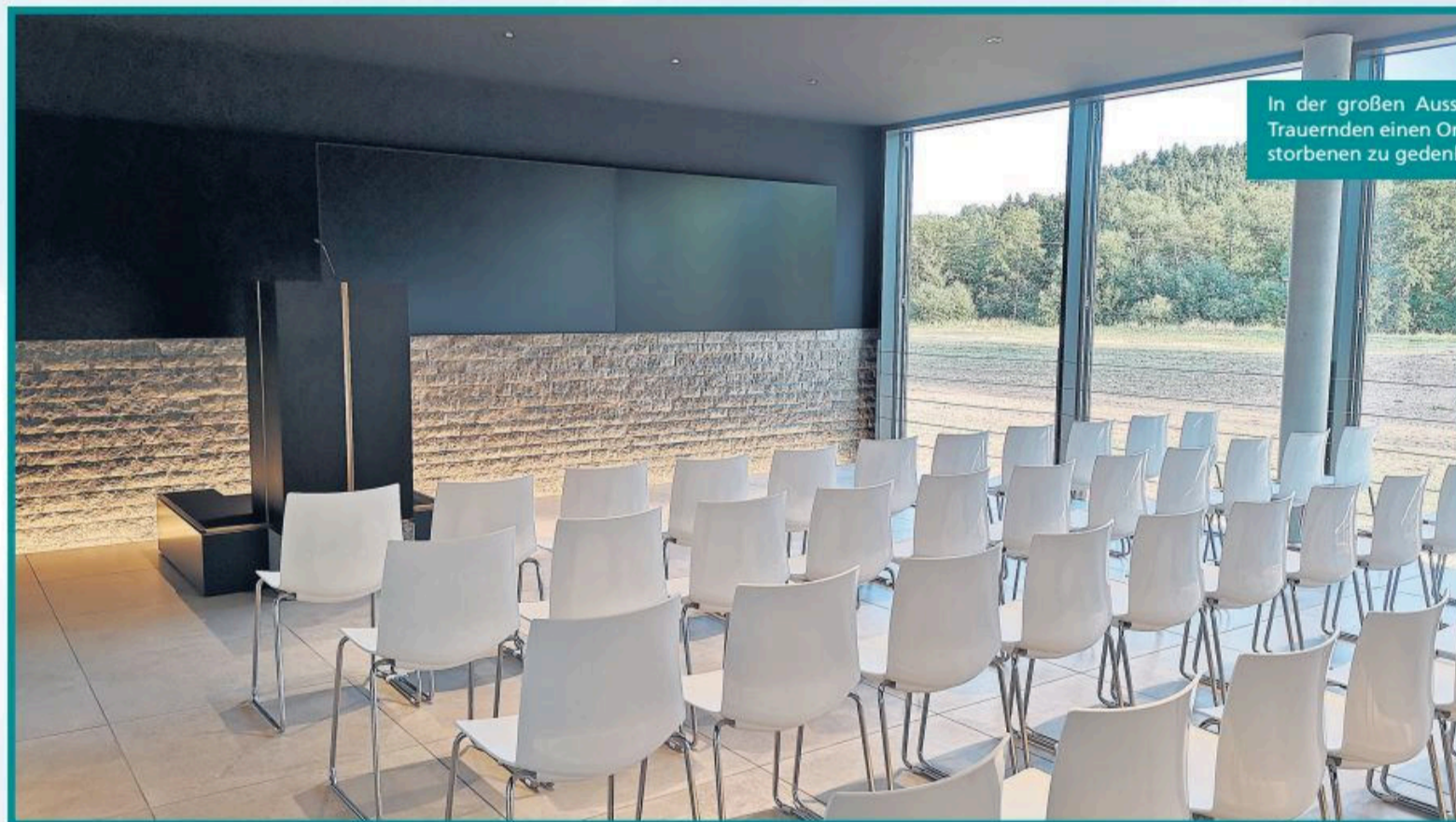
In der großen Aussegnungshalle haben die Trauernden einen Ort, um in Frieden dem Verstorbenen zu gedenken.

Doch auch die kreativen Ausstellungen sind ein Grund zu kommen. Unter anderem zeigen Karikaturen über das Sterben, Tod und Trauer einen ganz anderen Blickwinkel auf das ernste Thema. Die Ausstellung zu Trauertattoos demonstriert den künstlerischen Umgang mit dem Abschied eines geliebten Menschen. Interessant ist auch zu sehen, wie sehr sich Bestattungswägen im Laufe der Zeit verändert haben. Musikalisch unterhält Colors Bamberg, Tutti Frutti, klassisch wird es mit dem Duo Orfeo. Schunders Einweihung der Trauerhalle ist nicht nur die feierliche Darstellung des neuen Gebäudes, sondern auch eine frische und moderne Herangehensweise an das eigentliche Tabuthema Tod – absolut erlebenswert.